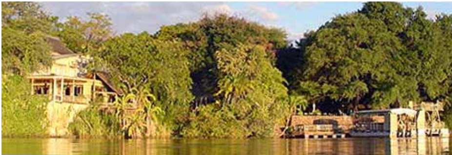
Il lodge visto dal fiume Chobe