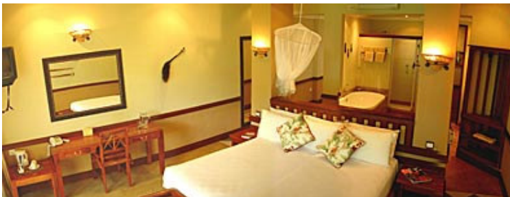
La Safari Room