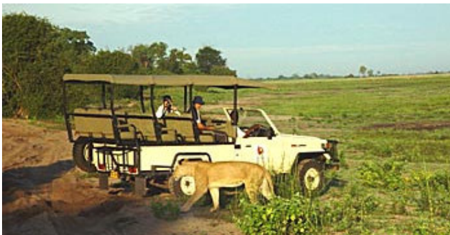
Safari nel Parco